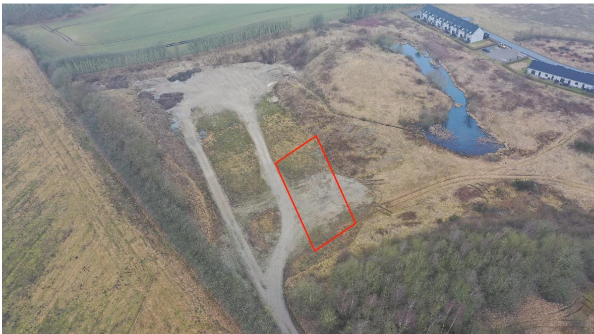
Figur Fejl! Bogmærke er ikke defineret. Ønsket placering af midlertidigt oplag på del af matr.nr. 20a Hørby By, Hørby.

Placering af det midlertidige oplag fremgår af nedenstående luftfoto.